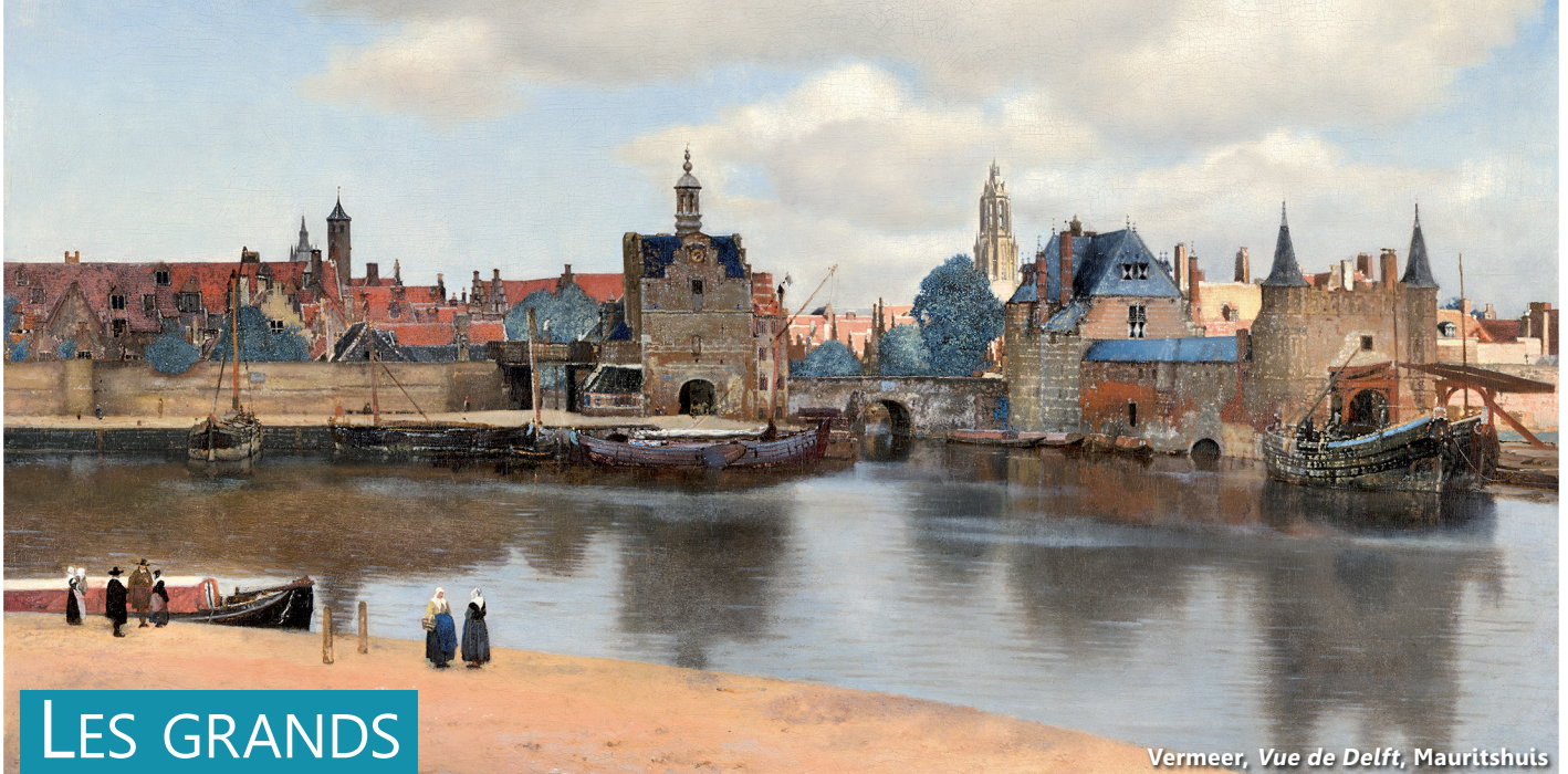
Vermeer, Vue de Delft , Mauritshuis